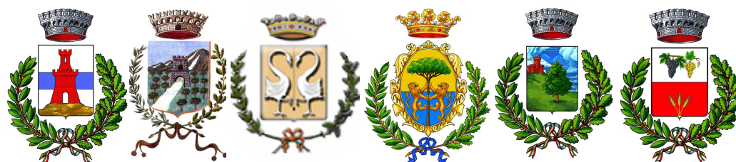
Comune di Sciarra Comune di Scillato Comune di Sclafani Bagni Comune di Sperlinga Comune di Valledolmo Comune di Vallelunga Pratameno