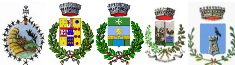
Comune di Alimena Comune di Aliminusa Comune di Blufi Comune di Bompietro Comune di Caltavuturo